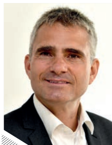
Holger Albrich Bürgermeister Stadt Sachsenheim

Ich freue mich auf kontroverse Diskussionen zu einem wichtigen Zukunftsthema mit Ihnen und den geladenen Gästen.